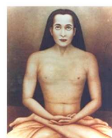
Kriya Babaji Nagaraj