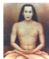
Kriya Babaji Nagaraj