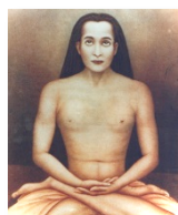
Kriya Babaji Nagaraj