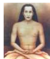
Kriya Babaji Nagaraj