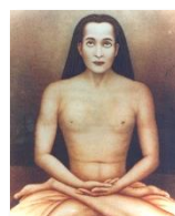
Kriya Babaji Nagaraj