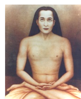
Kriya Babaji Nagaraj